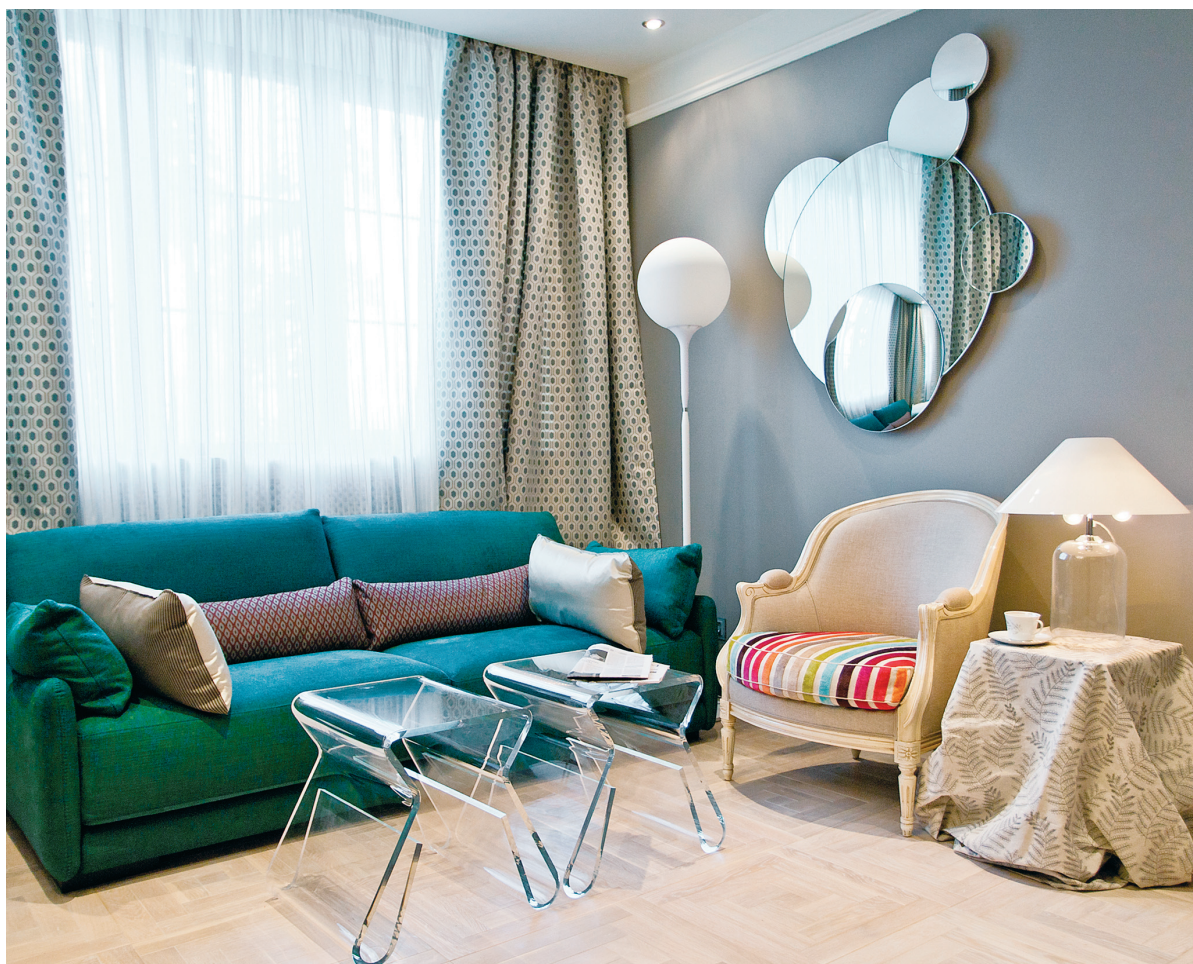
UN ESPEJO O UNA COMPOSICIÓN DE ELLOS OTORGA AMPLITUD Y PROFUNDIDAD VISUAL A CUALQUIER ESTANCIA.

Además de los espejos, Díaz reivindica materiales como el cristal para introducir un aire más moderno a nuestros hogares. «Una pared de cristal permite acotar y diferenciar unas zonas de otras, como el salón del comedor. Y un mueble, como una mesa de centro o auxiliar de cristal, además de encajar en todos los estilos, aporta ligereza visual y fluidez a una estancia pequeña», señala.