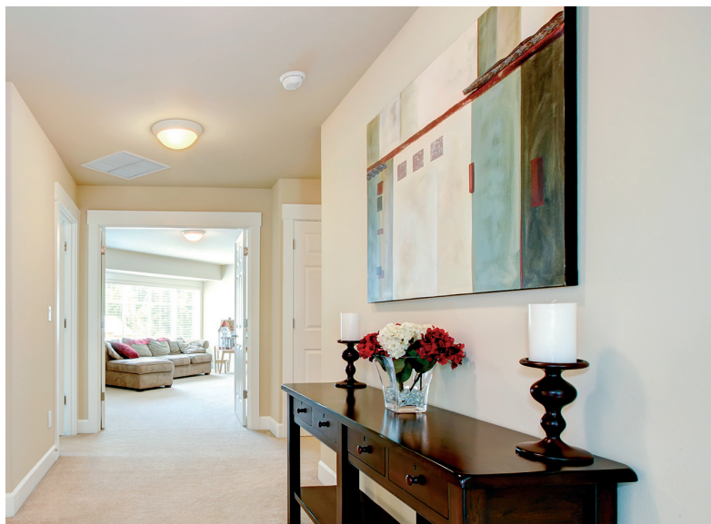
EL 'TOTAL WHITE' CON COMPLEMENTOS OSCUROS OTORGA LUMINOSIDAD AL PASILLO.

Los indecisos pueden decantarse por combinar papel y pintura y de esa forma conseguir que el techo se vea más alto de lo que realmente es, disimulando visualmente la estrechez del pasillo. Puedes emparejar con un motivo a rayas un zóca-