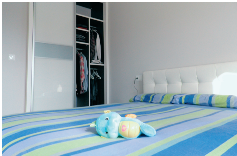
LA TENDENCIA EN LOS FRENTES SON LOS CRISTALES LACOBEL MEZCLADOS CON LACADOS.

En cuanto a las tendencias lo más solicitado son los frentes lacados con cristales lacobel de colores pastel, «por ejemplo, el tabaco y los grises pálidos... En los interiores se están poniendo mucho unas melaninas de textil de diferentes tonos», en lugar de la madera de roble habitual.